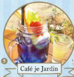
Café je Jardin

びわ湖ブルーラテ (ラテアート&ビスコッティ付) 500円（税込） パタフライピーティーにホワイトチョコとヘーゼルナッツを合わせたミルクのラテです。