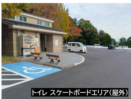
トイレ スケートボードエリア(屋外)