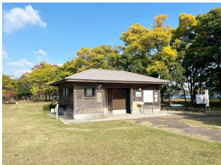
トイレ 源氏浜(屋外)