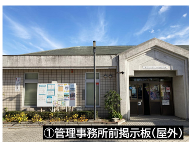
①管理事務所前掲示板(屋外)