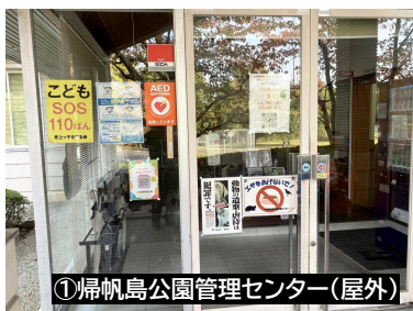
①帰帆島公園管理センター(屋外)