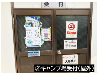
②キャンプ場受付(屋外)