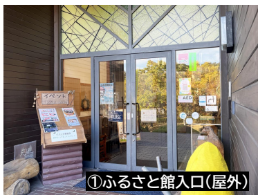
①ふるさと館入口(屋外)