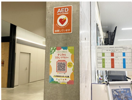
平和堂HATOスタジアム事務所(屋内)