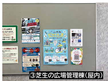
③芝生の広場管理棟(屋内)