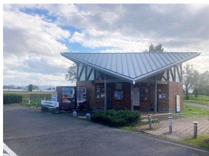
志那1中トイレ掲示板(屋外)