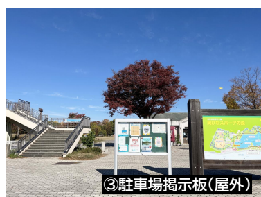
③駐車場掲示板(屋外)