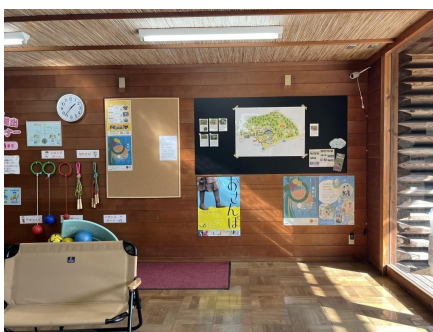
公園管理事務所(屋内)