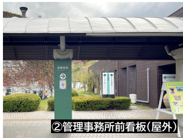
②管理事務所前看板(屋外)