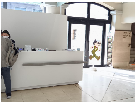
安土城考古学博物館受付