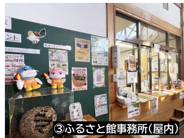
③ふるさと館事務所(屋内)