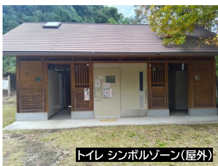
トイレ シンボルゾーン(屋外)