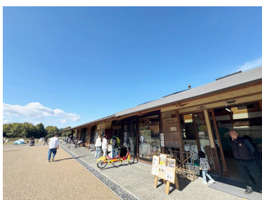
森づくりセンター(屋外)